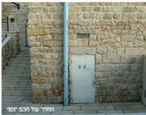
החדר של חכם יוסף