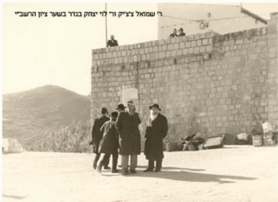
ר' שמאל צ'צ'יק ור' לוי יצחק בנדר בשער ציון הרשב"י