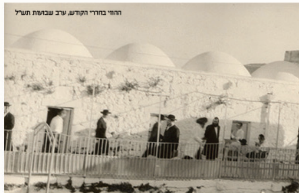
ההוי בחרי הקודש, ערב שבועות תש"ל