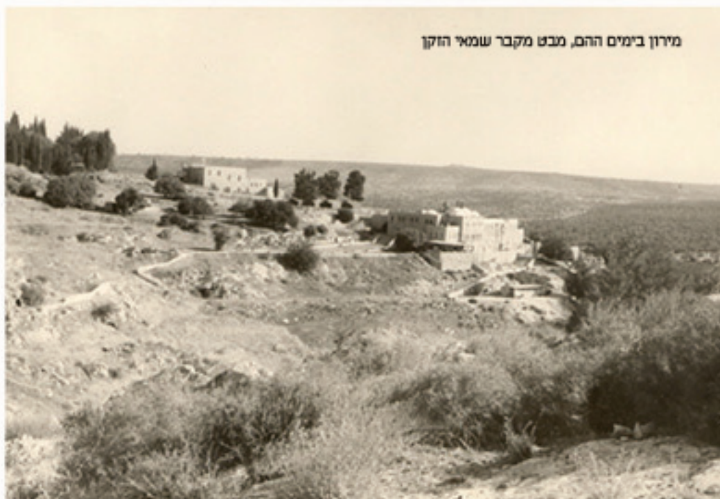
מירון בימים ההם, מבט מקבר שמאי הזקן

גם בשנת תשכ"ז, לפני חמישים שנה בדיוק, ימים ספורים לפני המלחמה שפרצה בשלהי חודש אייר, כאשר פחד וחרדה אפף את בני הישוב מפני הבאות ומעטים עשו את דרכם מירונה, הרי שמבין הציבור המצומצם שהצליחו להגיע למירון באותה שנה בלטו ביותר אנ"ש שחרפו נפשם ונסעו למירון בדרך לא דרך להשתתף בהילולא קדישא