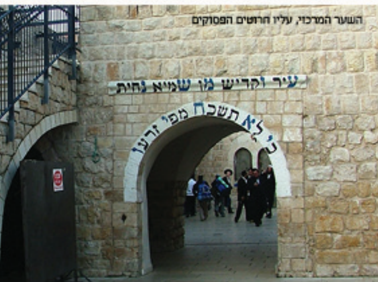
השער המרכזי, עליו חרוטים הפסוקים