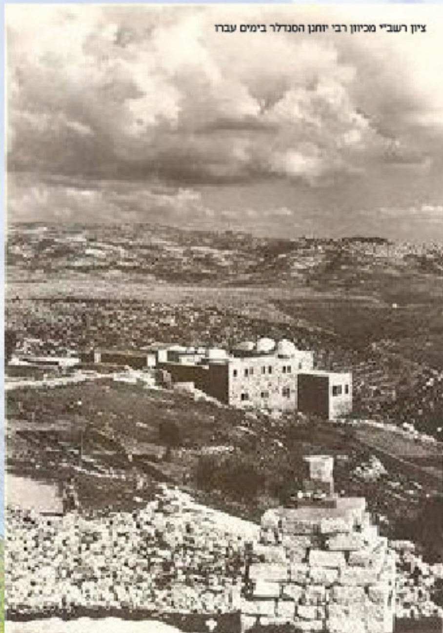
ציון רשב"י מכיוון רבי יוחנן הסנדלר בימים עברו

כי לא ישקוט עד שיגמור הדבר בשלמות, חוזר ומתגלה בצלמם ודמותם של גדולי הצדיקים יחיד הדורות, המשליכים נפשם מנגד ומבקשים ומחפשים את בת המלך, שכבת עזו יתברך. יקום נצח קרבין דהא ברטא ומלכא דילך איהי (זהר ח"ט ספרא תנינא).