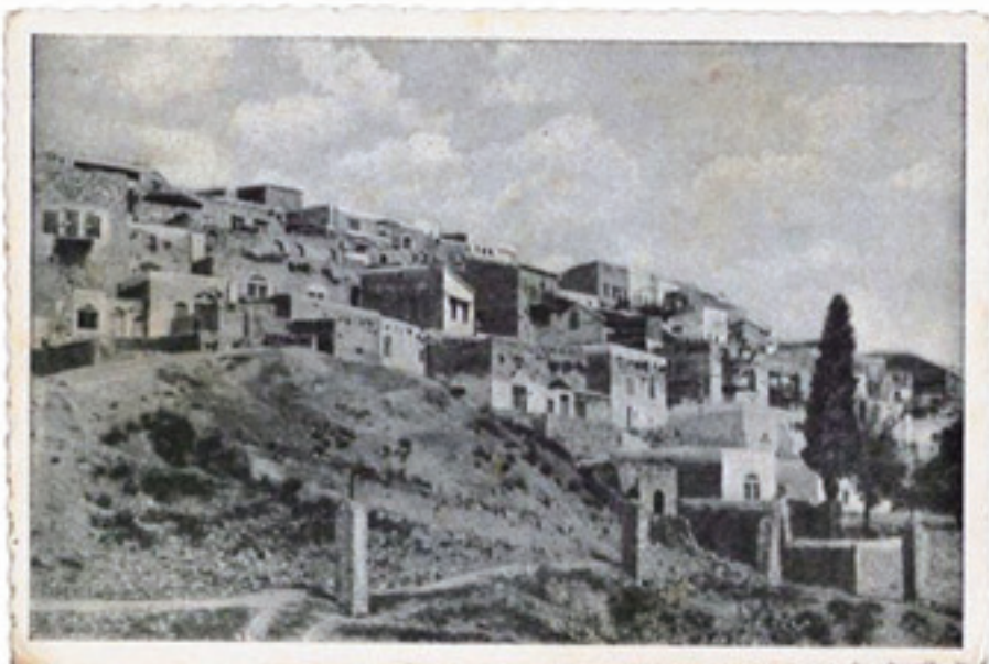
צפת של מעלה