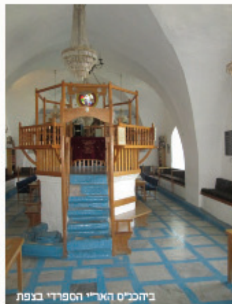
ביהמ"ד האר"י הספרדי בצפת