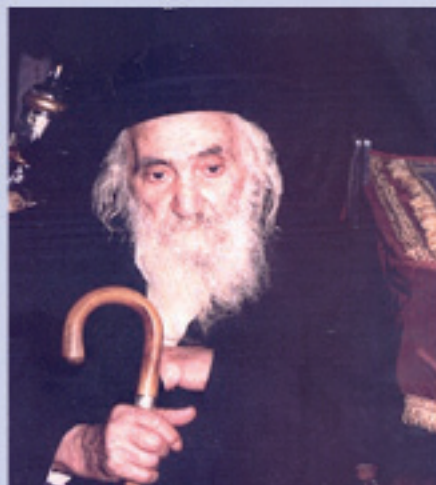
רבי ישראל בער בוקנטו

'כי צויכין לבחור לו מקום ולקבוע לו תשובה ותענית ולהתגעגע תמיד ולהשתוקק תמיד אליו